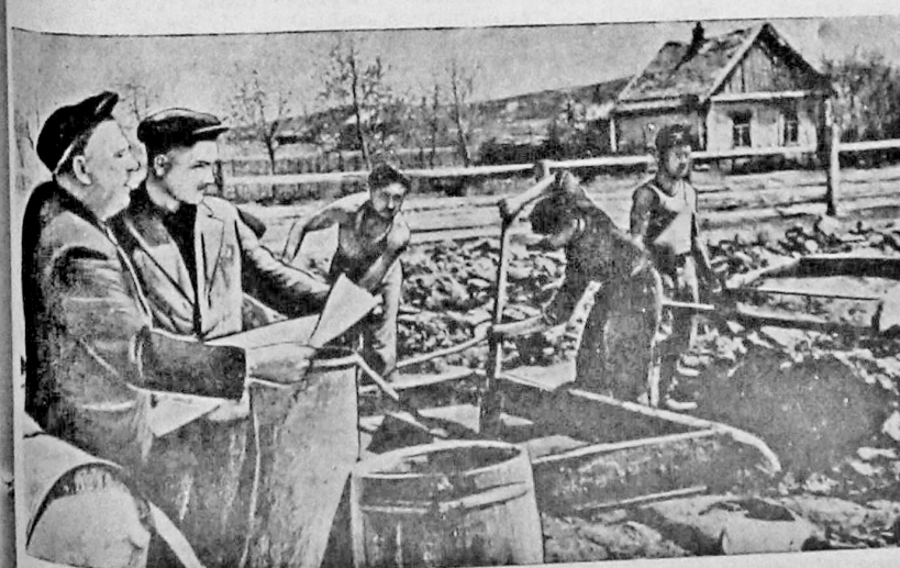
Коллектив рабочих комбикормового завода приступил к строительству зернохранилища для сортировки семян в подшефном колхозе «Путь к коммунизму» Ворошиловского района. Сейчас уже закончена кладка фундамента. На снимке: на строительной площадке в колхозе «Путь к коммунизму».

ГИРЯНСКИЙ. Бухгалтер колхоза «Шуфанский ударник».