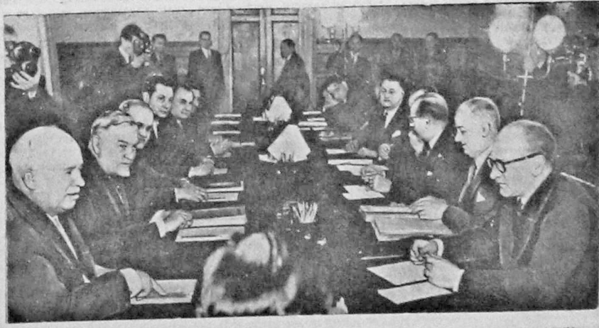
В Москве состоялись переговоры между Правительственными делегациями Союза Советских Социалистических Республик и Французской Республики. На снимке: в зале заседаний.

С каждым днем растет производительность труда на кирпичном заводе № 102. Соревнуясь за досрочное выполнение плана первого года шестой пятилетки, труженники завода вяжи обязательство выдать в мае 50 тысяч штук кирпича сверх плана. Свое обязательство они подкрепляют делом. План 20 дней мая они выполнили на 110 проц. Первенство в соревновании удерживает цех обжига. Коллектив этого цеха систематически перевыполняет сменные задания. Образцы в труде показывает комсомольско-молодежная смена, руководимая мастером т. Сидоровым.